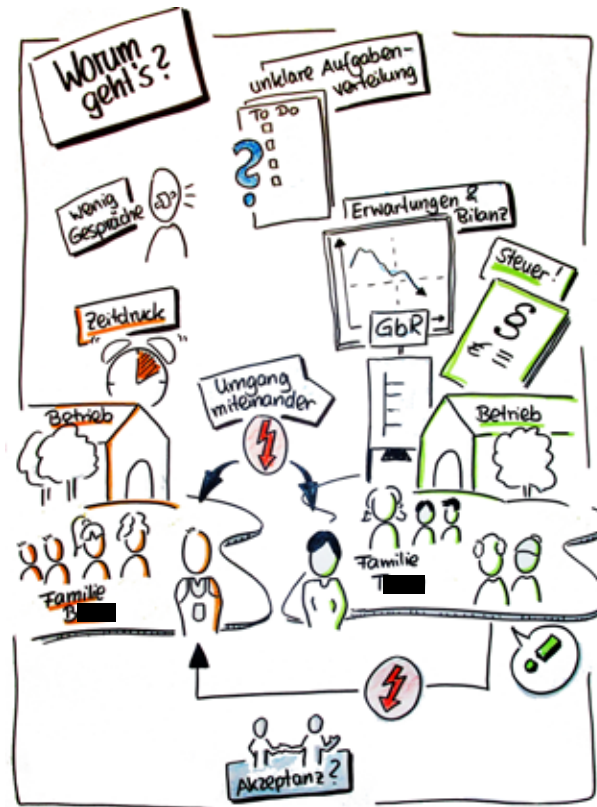
Visualisierung der Themen, Akteure und Konflikte in Phase 2 der Mediation