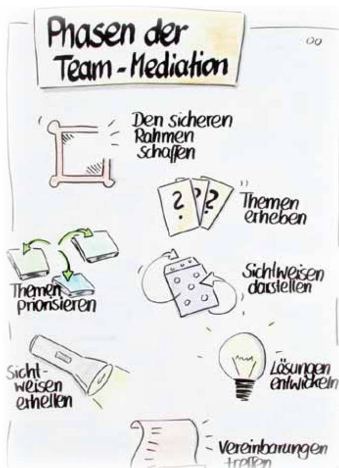
Vorbereitetes Flipchart zu den Phasen der Team-Mediation

Flipcharts, die ausschließlich Informationen präsentieren, bereite ich komplett vor, z. B. den Ablauf der Mediation, den sicheren Rahmen oder auch die „Spielregeln“.